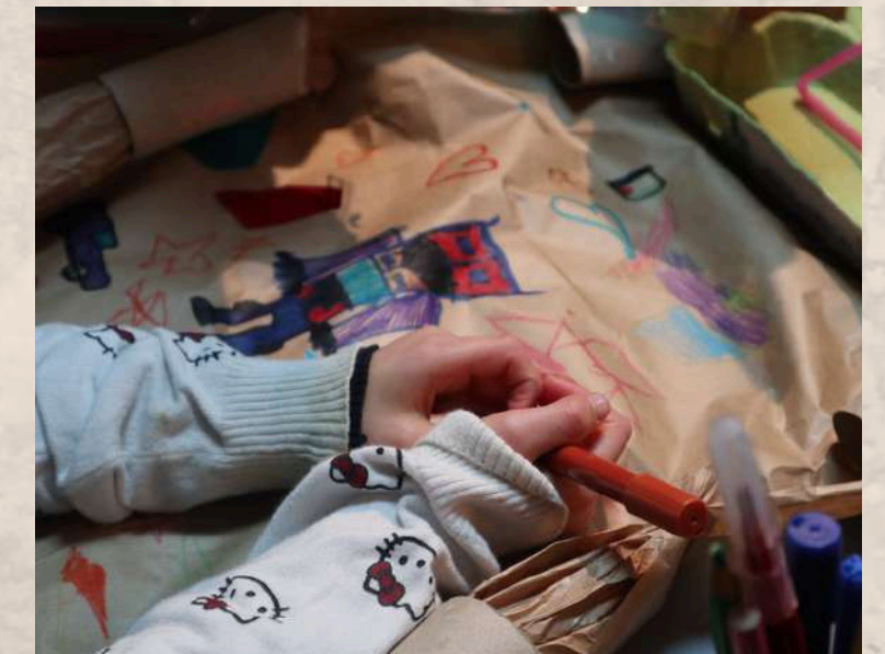
Centre Les Monis, Centre les portes du Midi, Collège Rabelais (94)